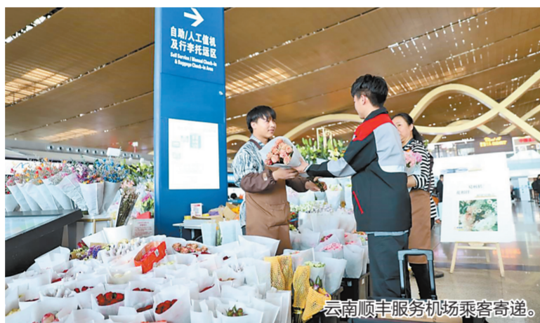
云南顺丰服务机场乘客寄递。

目前，云南顺丰已在昆明长水国际机场航站楼投入2个营业站，分别位于出发层F3站点—国内出发A区、到达层B1站点—国内到达A出口，24小时有专人在岗，每天6时至22时提供行李寄存服务。因携带不便需要寄存的行李，旅客只需到顺丰服务站点，现场扫码下单，快速完成寄存，再结合个人安排凭二维码随时取回。