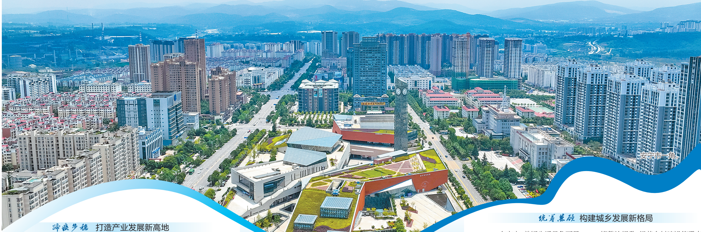
蹄疾步稳 打造产业发展新高地

百强县…… 这是安宁市保持战略定力、持续深化改革，认真落实云南省“3815”战略发展目标和昆明市“六个春城”部署要求取得的累累硕果，围绕“新型城市化先导区，昆明现代工业基地”发展定位，统筹推进“生态优先”“工业立市”“昆安融城”“共同富裕”四大战略，一路改革破题、奋楫扬帆攻坚克难的生动实践。 安宁正以一地之精彩，为全省发展添彩。