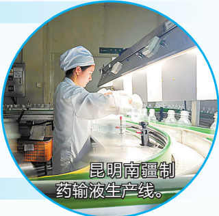
昆明南疆制药输液生产线。

昆明市及滇中新区拥有 1 个大学城、 2 个职教基地、 50 多所 高等院校、 10 余个国家重点实验室和工程中心 开设近 70 个东南亚、南亚小语种专业 与国内和南亚东南亚地区保持长期教研培合作 具备较好的区域协同创新环境