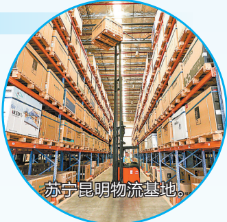
苏宁昆明物流基地。

赴京津冀、长三角、珠三角等区域开展精准招商 2097 次 引进到位资金 12004.82 亿元 共引进 1029 个项目落户新区 其中,引进世界五百强企业 17 家,中国五百强企业 23 家