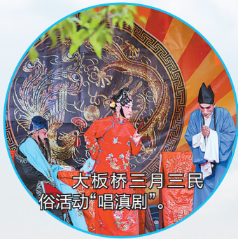
大板桥三月三民俗活动“唱滇剧”。