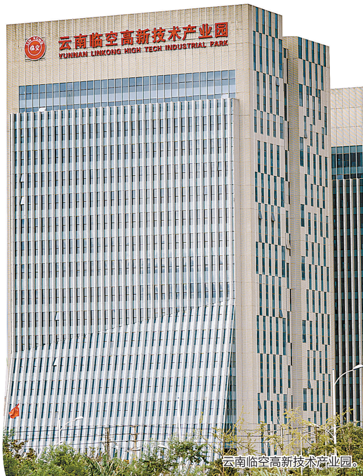
云南临空高新技术产业园。