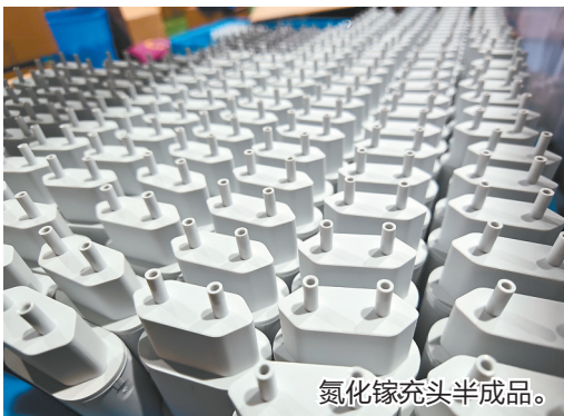
氮化镓充电器半成品。

中心,依托滇中新区的政策扶持,整合合作多年的产业链上下游优质资源,将手机、智能手表所有零配件(包括手机电池、智能手表电池等)的生产流程都在园区内打通、完成,全力建成云南省首家手机、平板电脑、智能穿戴设备的全产业链企业,打造面向南亚东南亚乃至全球的集智能终端整机、