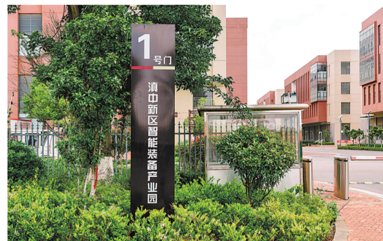
建成投用的滇中新区智能装备产业园项目。

今年以来,围绕中央、省、市和滇中新区一系列关于低空经济的安排部署,滇中产业发展集团抢抓低空经济发展机遇,开展了一系列相关工作的谋划和推进。