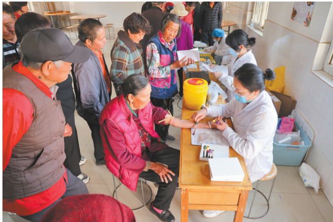
2024年，滇中新区在实施“双百行动”中，把辖区免费体检年龄由原来的65岁放宽至60岁。这是3月29日，中对龙居民小组50多位老人按预约到党员活动中心体检。

习近平总书记指出，“为者常成，行者常至，历史不会辜负实干者。”2024年，滇中新区全面贯彻新发展理念，主动融入和服务新发展格局，围绕全省“3815”战略发展目标，紧盯“六个春城”建设，大力实施“百件实事比作为百舸争流建新功”双百行动，坚持干在实处、走在前列、勇立潮头，用实干擦亮为民造福的时代底色。