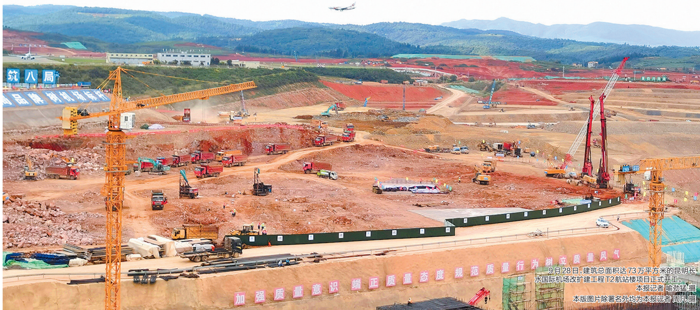
9月28日，建筑总面积达73万平方米的昆明长水国际机场改扩建工程T2航站楼项目正式开工。