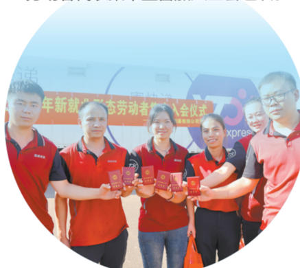
6月18日，滇中新区新就业形态劳动者代表集中宣誓加入工会组织。