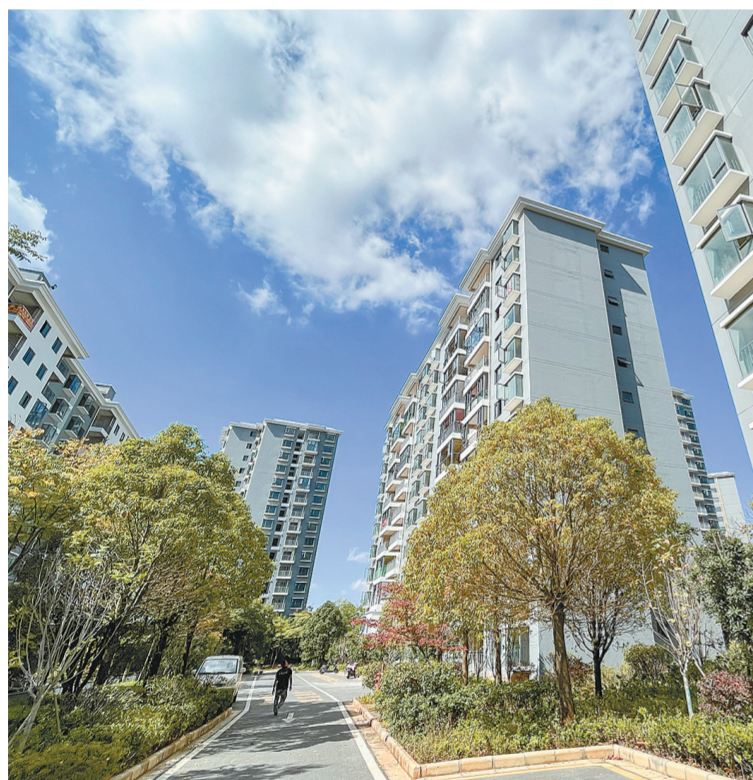
大板桥街道云翔苑小区是昆明长水国际机场改扩建工程安置搬迁小区。