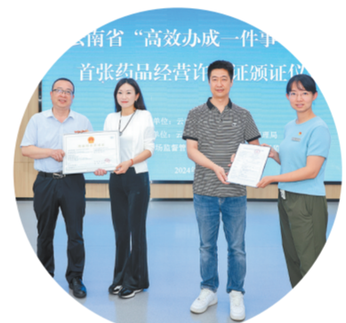
6月14日，滇中新区发出首张“高效办成一件事”药品经营许可证。