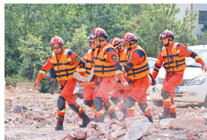
5月16日，在花箐—2024汛期避险疏散应急演练现场，人员营救组演练搜救和转移受伤居民。