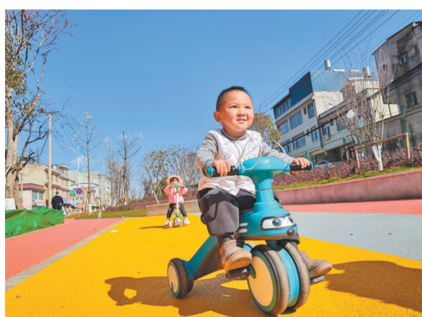
2024年，滇中新区全新打造的“口袋公园”陆续开放，为当地居民提供了全新的锻炼与休闲场所。