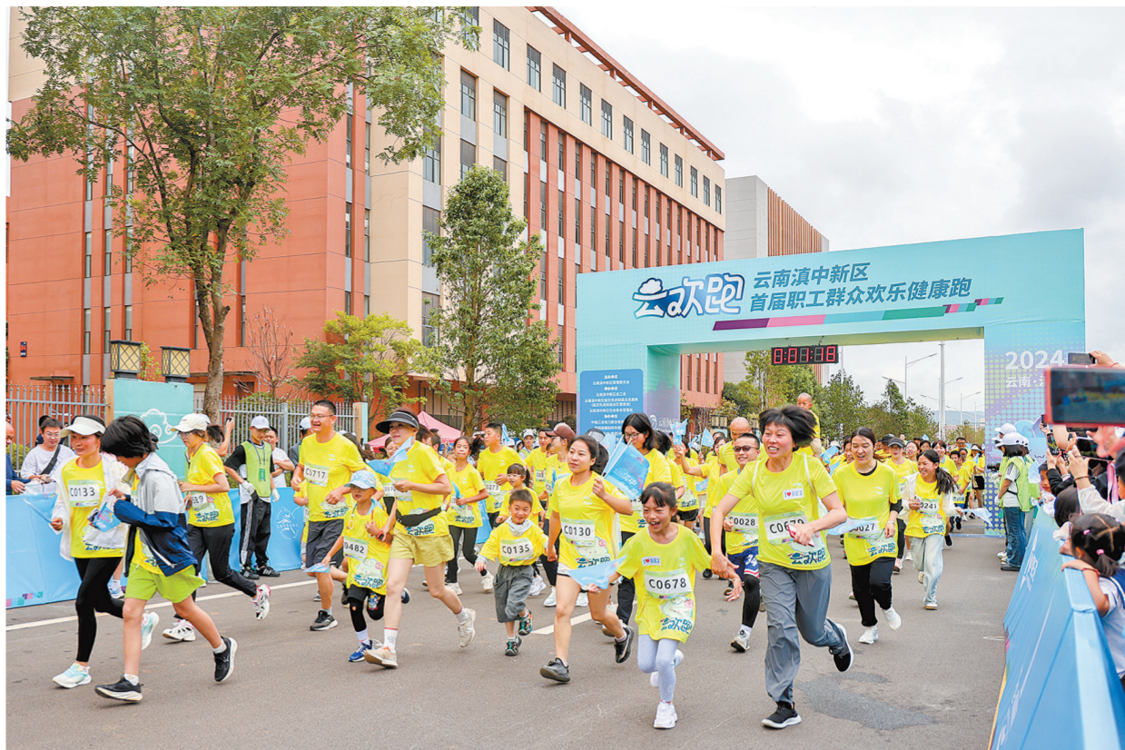
7月20日，近2400名跑友齐聚滇中新区参加“云欢跑”。